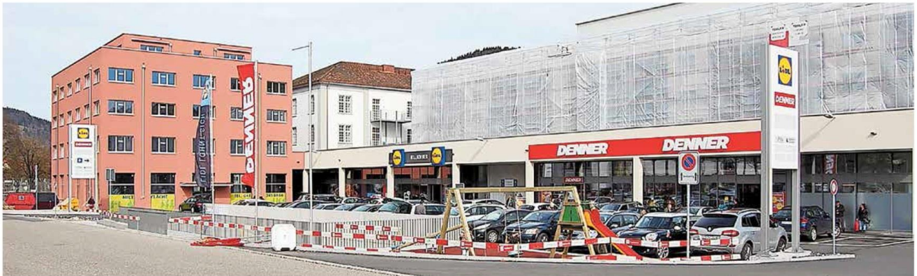
Das Ensemble besteht aus dem Altbau, einem Längsbau mit Läden und dem Solitär an der Bahnhofstrasse.